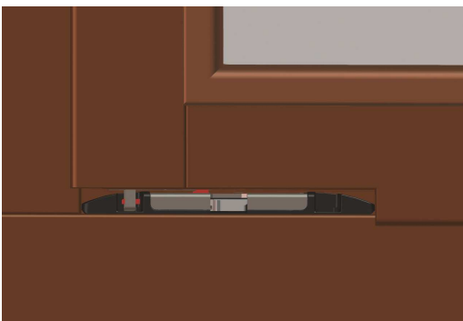
Das Fenster ist geschlossen und gesichert. Der 8-Kant-Verschlussbolzen hinterkrallt beim Verschließen das Sicherheitsschließblech und die Zusatzverriegelung verriegelt mit dem Fensterflügel.